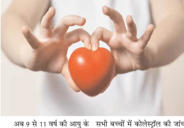
अब 9 से 11 वर्ष की आयु के सभी बच्चों में कोलेस्ट्रॉल की जांच

विश्लेषकों का अनुमान है कि ईरान की इस पारंपरिक नौसैनिक क्षमता का 80% से 90% तक नुकसान हो चुका है। रिवोल्यूशनरी गार्ड नौसेना (IRGC) यह अर्धसैनिक नौसेना असममित रणनीति पर आधारित है, जिसमें छोटे, तेज हमलावर नौकाएं, पानी में चलने वाले ड्रोन और समुद्री बारूदी सुरंगों का इस्तेमाल किया जाता है।