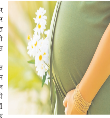
वायु प्रदूषण न केवल गर्भवती महिला के स्वास्थ्य को प्रभावित करता है, बल्कि यह गर्भ में पल रहे शिशु के विकास पर स्थायी प्रभाव भी डाल सकता है।