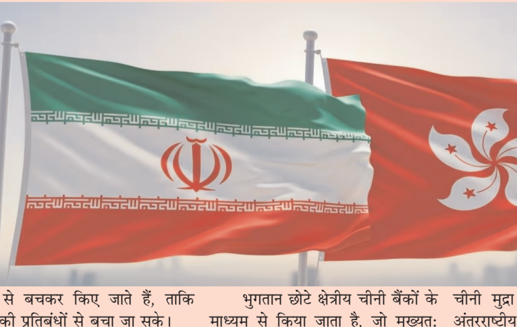
बैंकों से बचकर किए जाते हैं, ताकि अमेरिकी प्रतिबंधों से बचा जा सके।

इन कंपनियों के माध्यम से अरबों डॉलर के वित्तीय लेन-देन किए गए हैं। ये कंपनियां तेल विक्री से प्राप्त चीनी मुद्रा को डॉलर, यूरो या अन्य विदेशी मुद्राओं में बदलती हैं, ताकि अंतरराष्ट्रीय व्यापार किया जा सके। प्रतिबंधित तकनीक की खरीद हांगकांग स्थित कंपनियों का उपयोग पश्चिमी देशों के संवेदनशील इलेक्ट्रॉनिक उपकरणों और रॉकेट ईंधन से संबंधित रसायनों की खरीद के लिए किया जाता है, जो ईरान के ड्रोन और मिसाइल कार्यक्रमों में काम आते हैं। वैकल्पिक बैंकिंग व्यवस्था ईरान से जुड़े लेन-देन बड़े वैश्विक